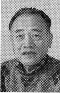
エアコンは1台で十分。CO2削減に大きく貢献できる

「湿度は高いところから低いところに自然に移動する。それを壁が妨害するから結露が起り、住宅の寿命を縮める。透湿、調湿できる壁なら問題ない」というのが持論だ。